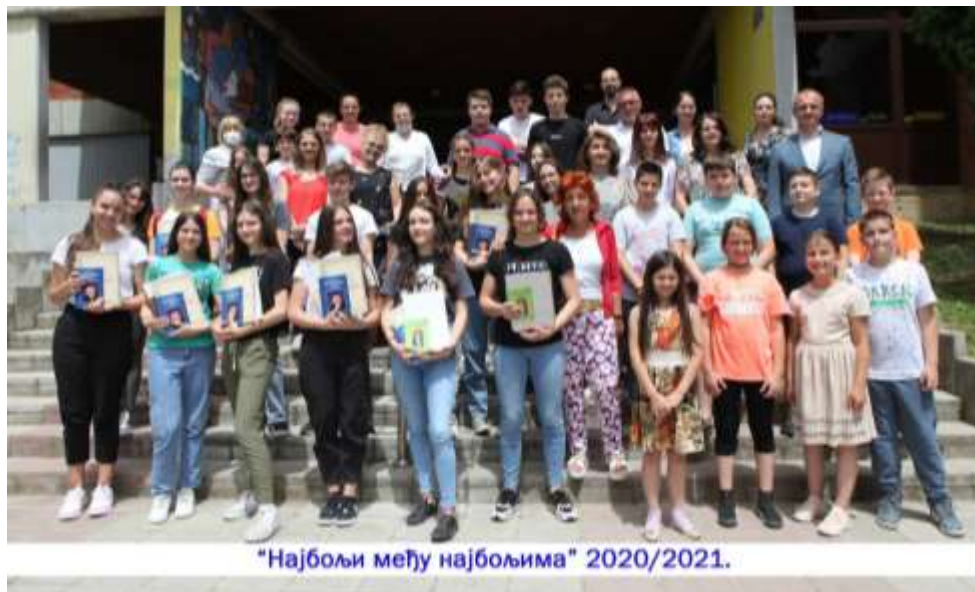
“Најбољи међу најбољима” 2020/2021.