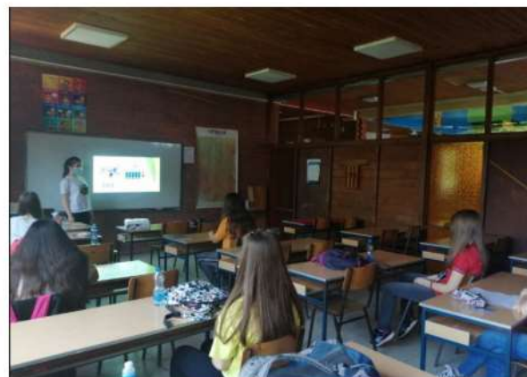
Реализација радионица у старијим разредима