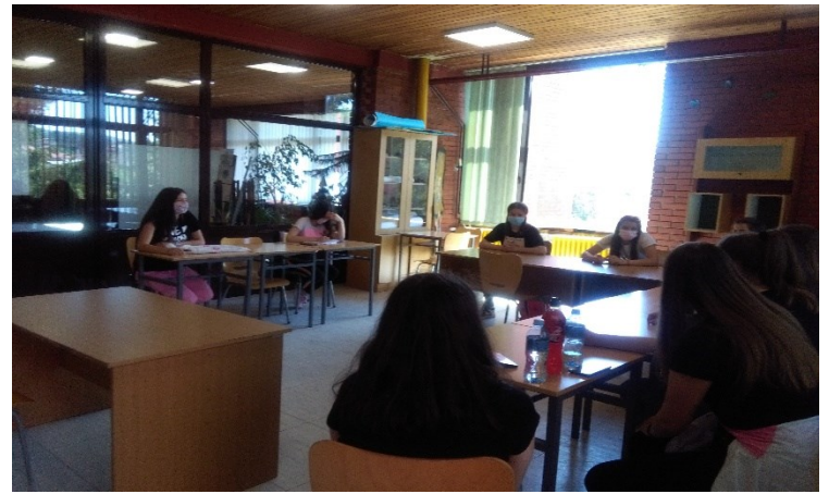
Обука вршњачких едукатора и осмишљавање радионица