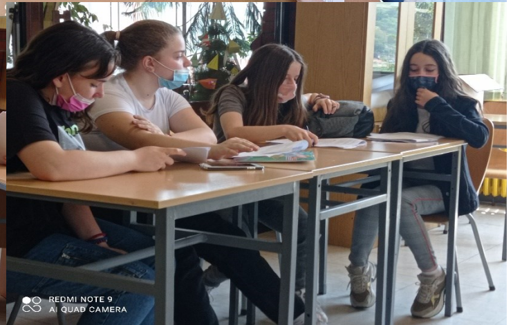
Пробе наших младих глумаца.