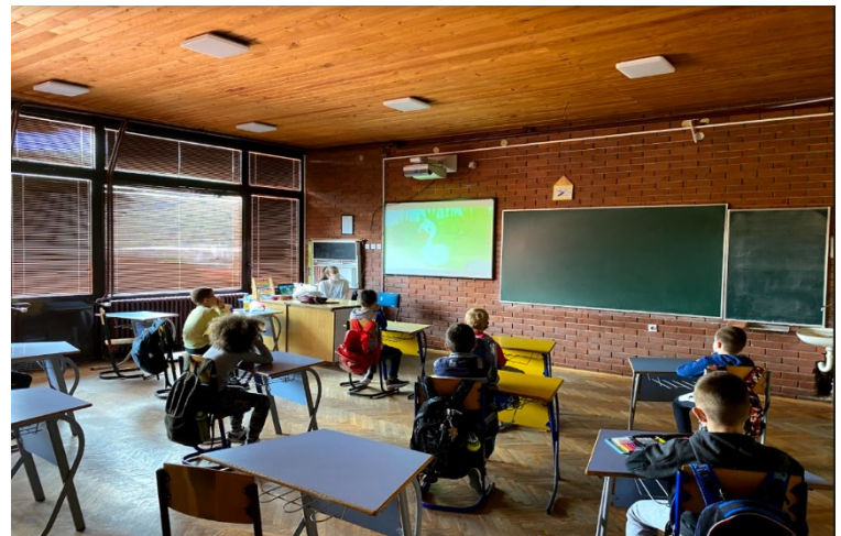
Реализација радионица у млађим разредима