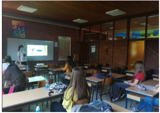
Реализација радионица у старијим разредима

Група ученика која припадају секцији „Дечје позориште Петица“ чија је намена да својим представама промовише значај дечјих права, а које је конституисано ове школске године, написала је сценарио за представу „О правима сцене које се тичу и тебе и мене“. Због епидемиолошких мера, снимљени су видео клипови за свих пет сцена, који ће ускоро бити објављени на сајту школе, а идуће године, надамо се и позоришна представа.